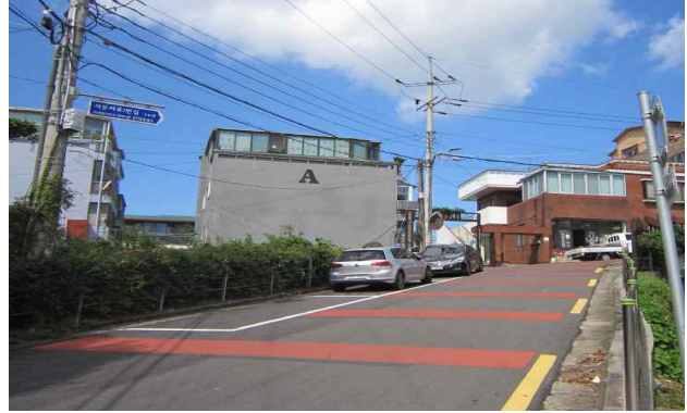
② 귀락모텔 (경사 8-10도)->