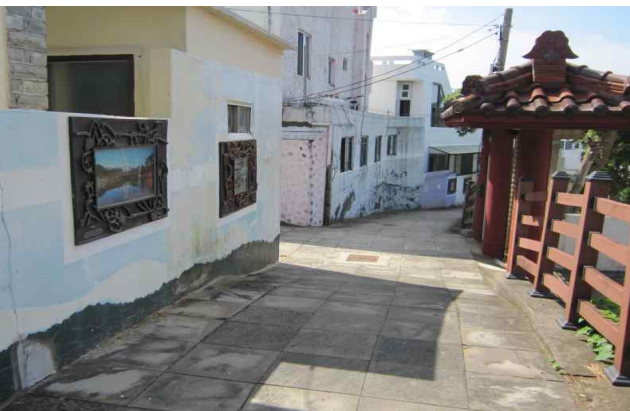
⑦ 법장사 진입 경사 5도 구간->