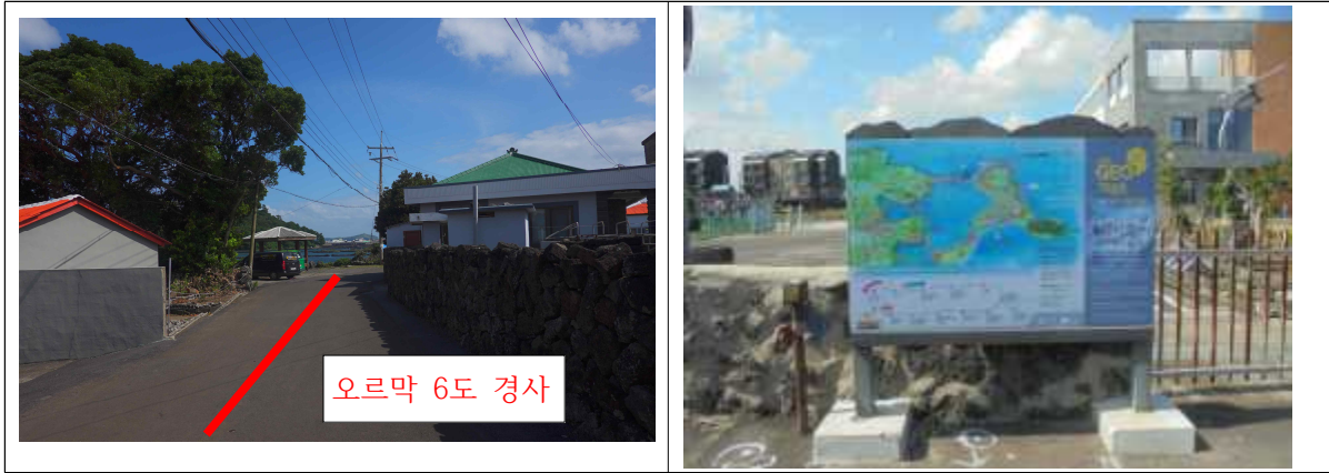
한줄설명 : 성산오조지질트레일 안내판에서 산책로 진입시 초입에 18m 거리의 6도 오르막