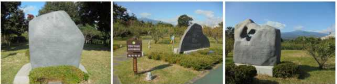
서귀포(이동주) | 서귀포(한기말) | 서귀포를아시나요(정태권)