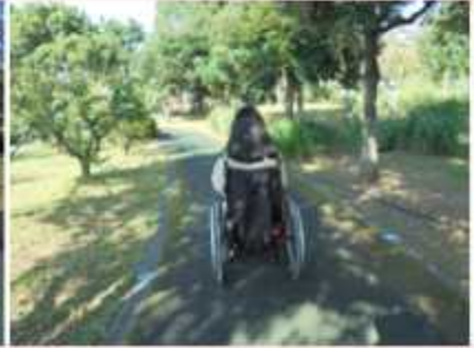
관람로 따라 이동 > 전망대 일간판 좌측 행 >