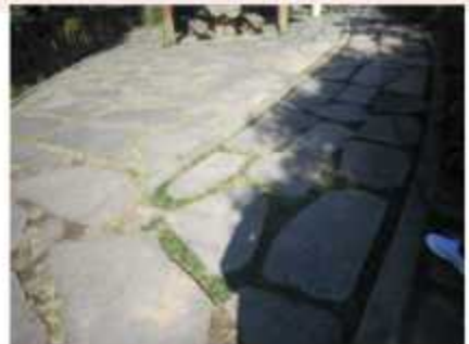
북포전망대 일간판 확인 (노면상태 판석 주의요함)