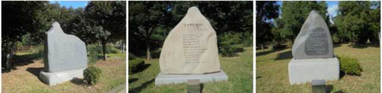
정방목포(박남수) | 정방목포앞에서(박재삼) | 그리운바다(이생진)