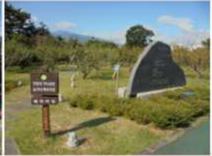
정자 앞 지나 전망대 일간판 확인 우측 행 >