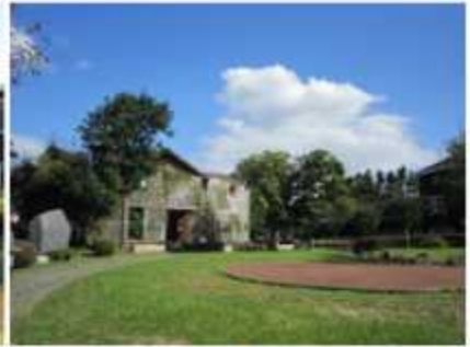
제주도지체장애인협회 주차장에서 이어지는 진입로 > 다리 건너 유토피아갤러리 앞에서 오른쪽방향으로 진행 >