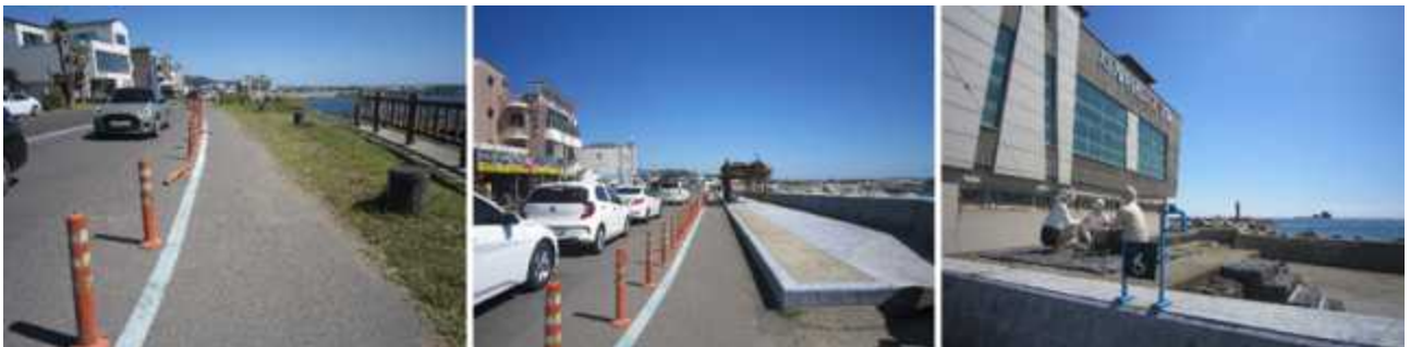
사계포구 다다르기 전 폭 좁아지는 구간 2975m 지점 ※ Issue 폭 140m