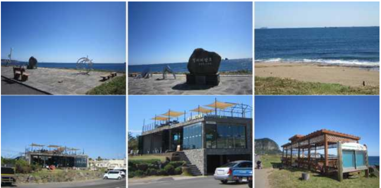
2472m 지점 (형제해안로 쉼터) ※ Issue 경사길이 55m (3°),