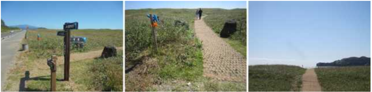
사계해변 산책로(코어네트) 에서 바다조망권.