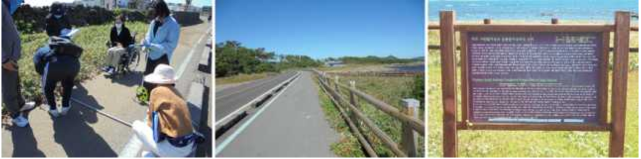
1008m 지점 (좁아지는 지점) ~ 1333m 지점('사람 발자국과 동물 발자국 화석 산지' 안내판)