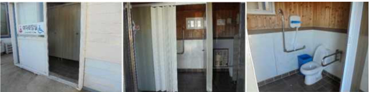
장애인화장실 (출입 경사로 짧은 길이의 높은 경사 주의 필요), 출입문은 자바라 문.