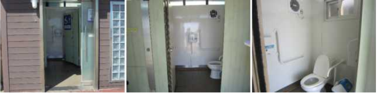
장애인화장실 (접이여닫이문 90cm, 대변기손잡이 설) 비상시사용도구 및 세면대 없음