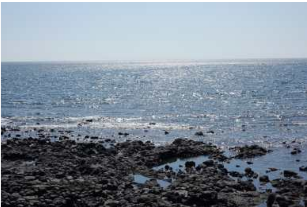
남태해안로에서 바라본 서귀포 바다

제주도의 매력 중 하나는 다양한 바다를 접할 수 있다이다. 에머랄드빛 이국적인 바다, 평범한 바다, 현무암이 있어 검은면서 푸른바다 등.. 서귀포의 바다는 모래사장 해변이 없는 편이다. 현무암이 있어 조화롭고, 저멀리 수평선만 보이는 드넓은 바다를 보고있자면 시나브로 그 바다에 이미 빠져들어 사색에 잠긴다. 남태해안로를 관광하면서 좋은 풍경을 배경삼아 사진도 찍고, 조용하게 힐링을 한다면 나만의 추억장소로 간직해도 될 듯 싶다.