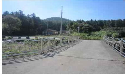
송당리 → 작은내교(오름방향) → 다리옆 w.p1-3