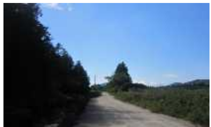
당오름 둘레길 → 삼거리 다리 → 다리 건너 좌측 방향 w.p12-13