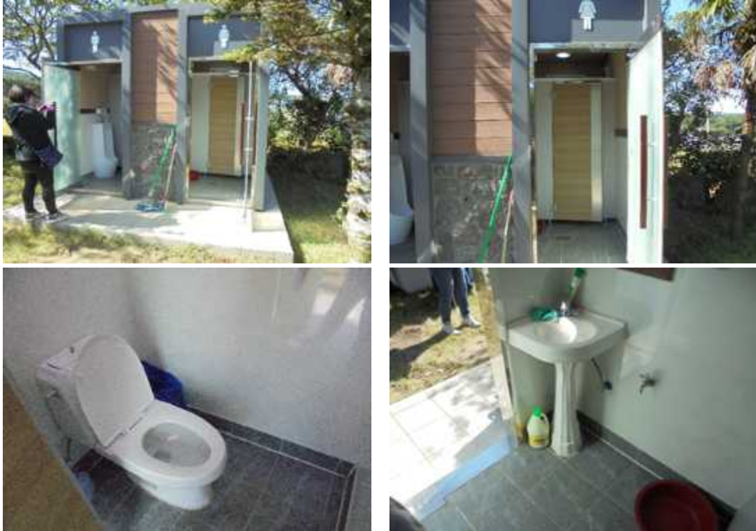
마로 쉼터 화장실