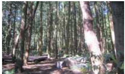
저류지앞→오르막 시작(2-5도)→괭이모루 둘레길 입구→삼나무 쉼터(오르막 종료) w.p7-11