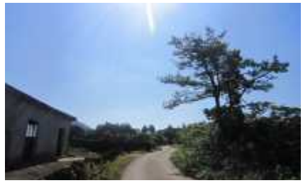
오르막 시작 → 오르막 종료 (2-5도) w.p4-6