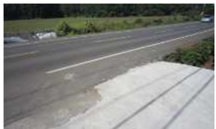
산책로 → 삼거리 좌측방향 → 일반도로 만나는 지점(회귀) w.p14