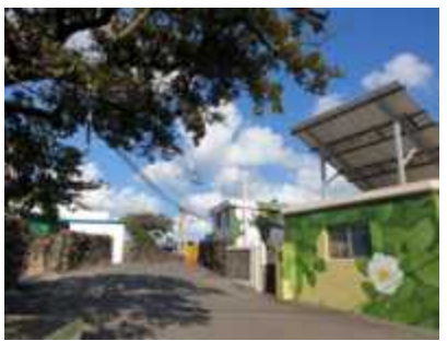
풍낭 앞 담 벽화