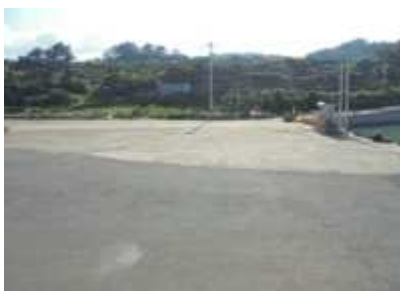
해동포구 앞 공터 (버스 대기 하는곳)