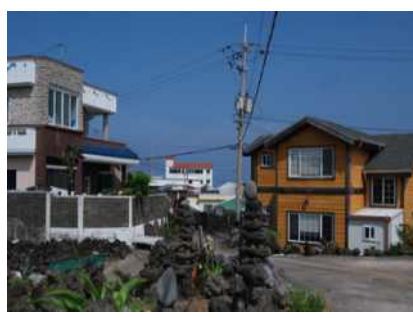
이장님 집 앞