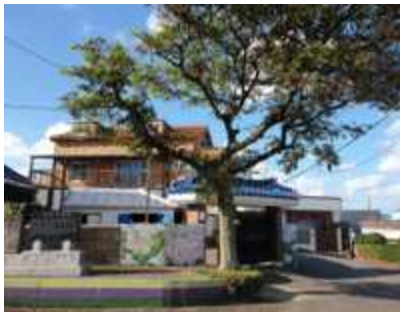
송덕비 와 나무