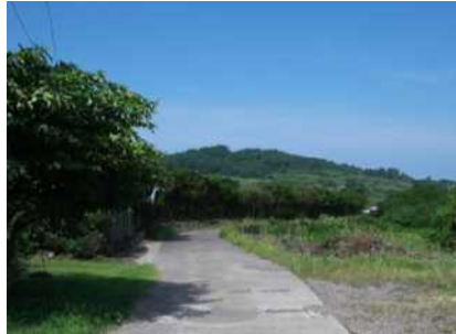
서우봉이 보이는 마을길