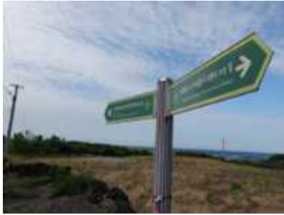
북촌마을 4.3길 이정표