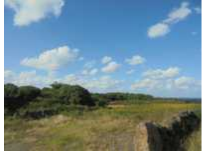
바다가 보이는 콩밭