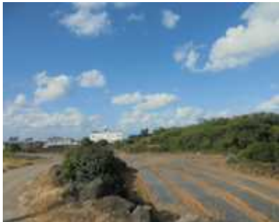
제주 돌담과 올레길 리본