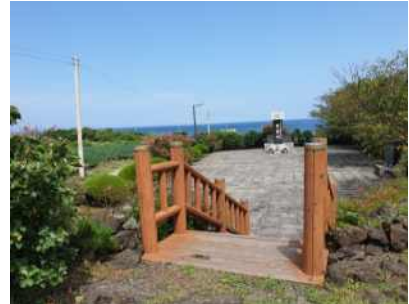
위령비로 가는 계단