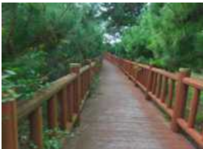
옹팡밭→ 위령비로 가는 테크길