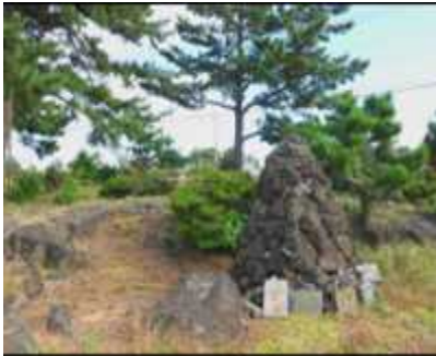
너븐숭이4.3기념관 앞 애기무덤