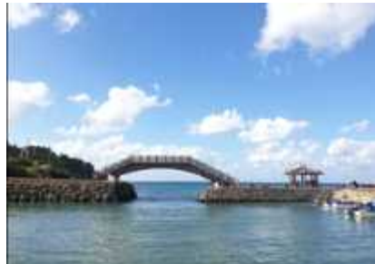
도착 : 해동포구