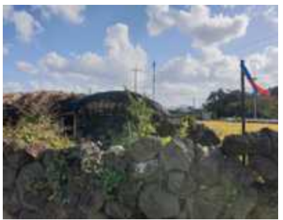
제주 돌담과 올레 리본