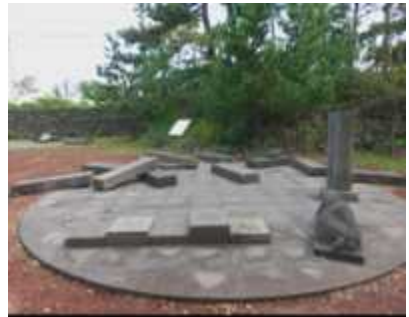
순이삼촌 문학비 (옹팡밭)