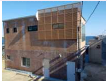
해안판석길~ 해녀잘의장 앞 (75m 길이)