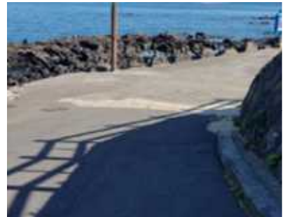
자구리 공원 입구 내리막 (경사15도 51m)