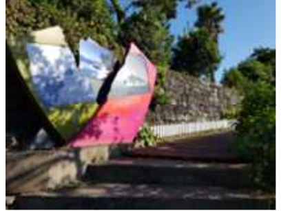
용천수 / 소낭머리 전망대 / 인도만나는 지점