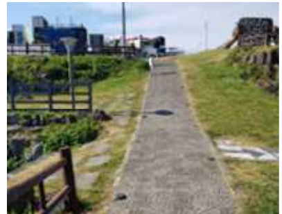
나무데크길 (오르막 7도 6m/내리막 14도 2.5m) ~ 현무암포장길(오르막 경사 16도 40m)