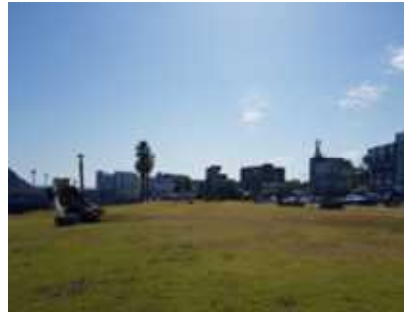
자구리 공원 입구