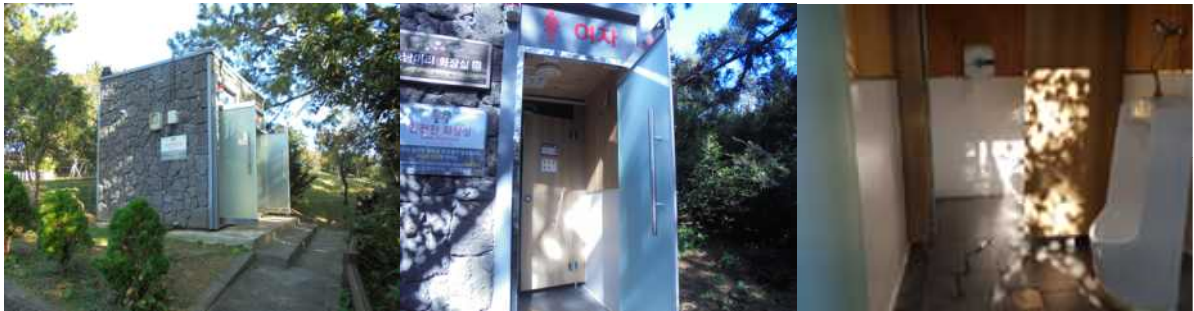
주변 대체 장애인 화장실 천지연폭포 매표소 장애인 전용 화장실