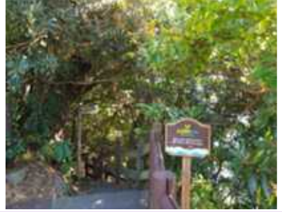
전망대 주차장 / 갈림길 계단 소낭머리 표지판