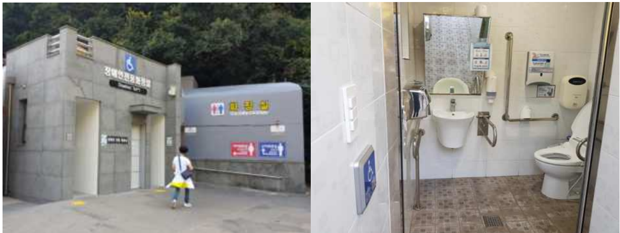
주변 대체 장애인 화장실 천지연폭포 주차장 장애인 화장실