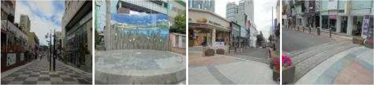
누웨마루 거리 시작 w.p45