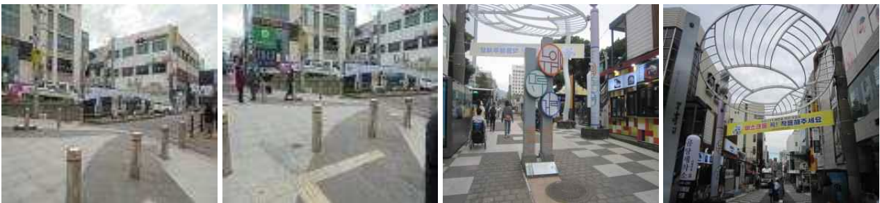
도로 교차점3 w.p49