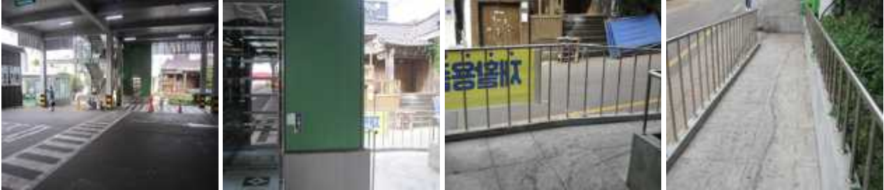
신제주 공영주차장 → 승강기 옆 경사로 w.p42-44

신제주공영주차장(wp.42) → 승강기 옆 경사로(wp.44) → 누웨마루 거리 시작(wp.45) → 도로 교차점1(wp.46) → 도로 교차점2(wp.47) → 휠체어 접근가능 카페 '파스쿠치'(wp.48) → 도로 교차점3(wp.49) → 반환점(wp.50)(반환점)