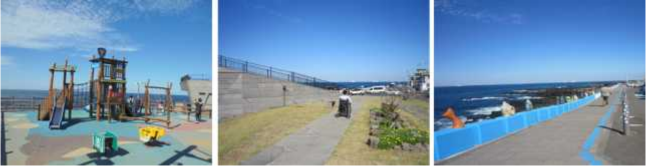
어린이놀이터/ 전망대 입구/ 어영소공원 종료