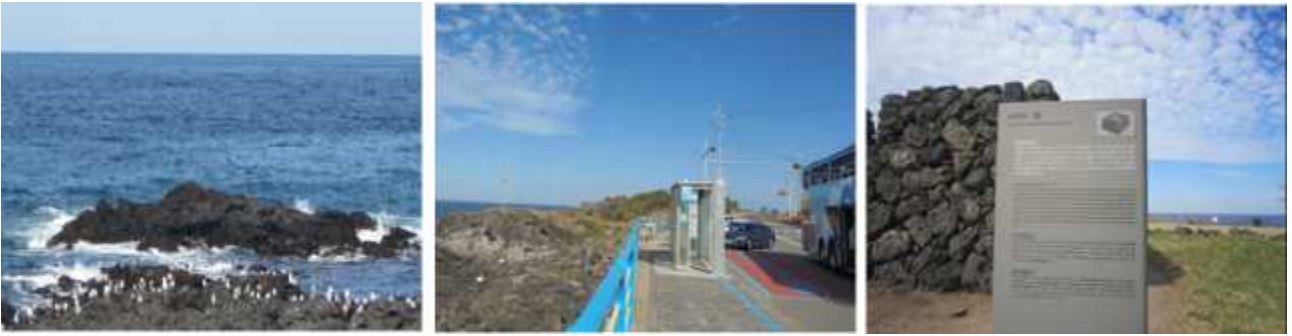
서해안로 버스정류장/ 수근연대/ 반환