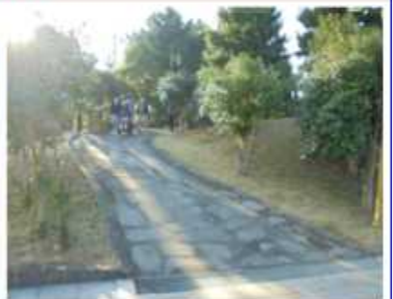
정문 주차장 가는 길 (숲 산책로) 54m 경사 5도 오르막/ 내리막 - 시작/ 종료 (w.p57->60)