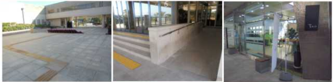
카페(타리) 입구 진입로