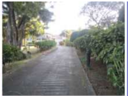
숲 산책로 종료 오르막 시작점/종료 13도 61m (w.p55.56)