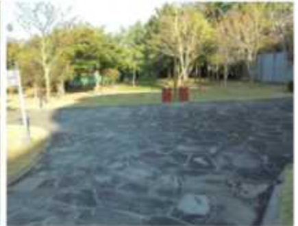
체험관 옆 내리막 시작(35m/ 9도)/ 연자방아(야외전시)/ 갈림길 좌측 (w.p49->52)